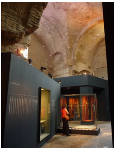
La première partie de l'exposition

L'exposition réunit près de 120 œuvres parmi lesquelles des épées datant du Ve au XVe siècle, des manuscrits, des peintures ainsi que des objets d'orfèvrerie. Les usages réels et symboliques de l'épée sont évoqués. Pouvant servir au combat, l'épée est aussi utilisée à la chasse et pour des usages plus symboliques comme le sacre des rois et les cérémonies d'adoubement des chevaliers. L'exposition présente également l'histoire de certaines épées légendaires telles Excalibur ou Durandal.