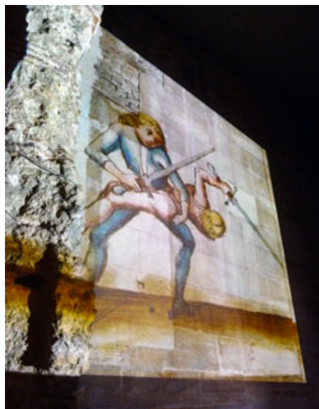
Traité sur l'art du combat

La présentation de certaines épées mythiques, telles celle de Roland, venue spécialement de Rocamadour, ou celle dite de Jeanne d'Arc, permettent de mettre en lumière la charge symbolique (religieuse, historique) portée par l'épée.