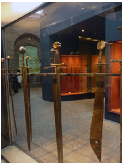
La vitrine des typologies d'épées

A vous de choisir l'ordre dans lequel vous déambulez entre les vitrines.