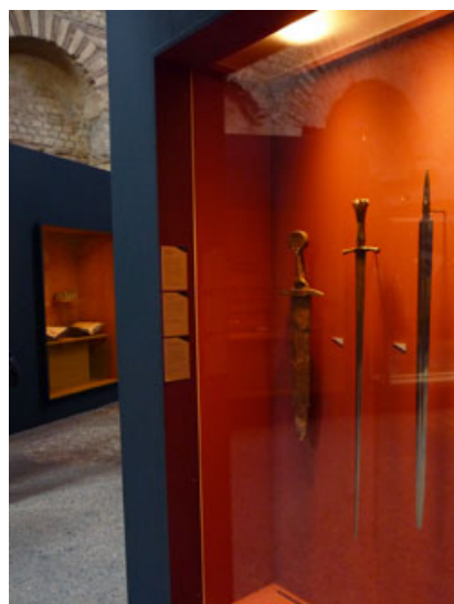
Certaines épées mythiques...

L'exposition revient donc sur les sens emblématiques et les clichés attachés à cet objet historique.