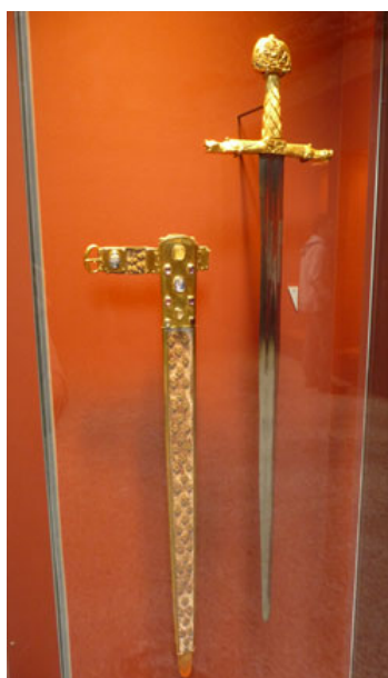
Joyeuse, l'épée de Charlemagne

L'exposition commence par la présentation du très célèbre portrait de Louis XIV par Hyacinthe Rigaud, image traditionnelle de la représentation royale, où le roi porte l'épée de Charlemagne, Joyeuse . Après cette entrée en matière entre histoire et symbole, le parcours de l'exposition est libre.